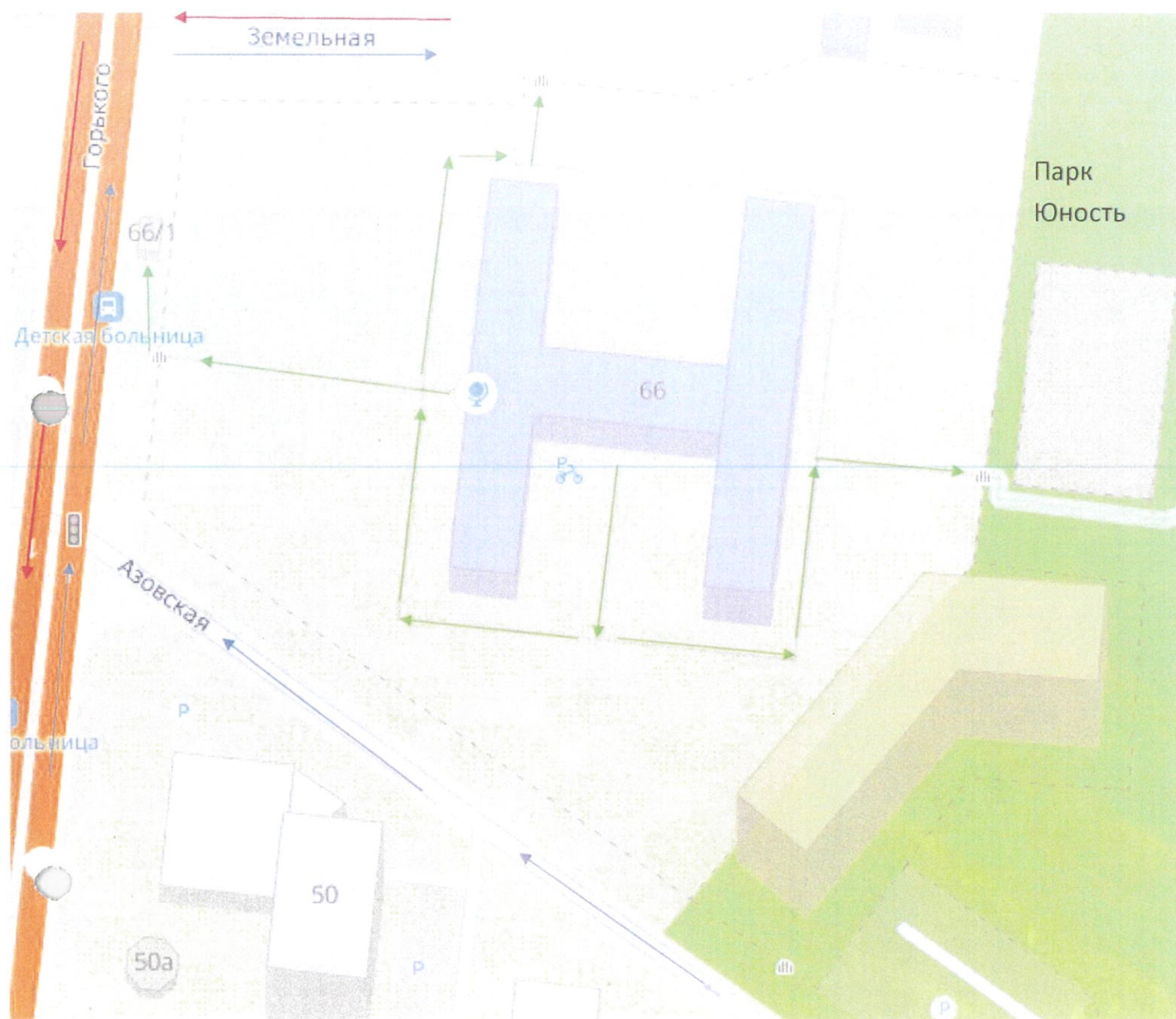
Схема организации дорожного движения в непосредственной близости от образовательного учреждения с размещением соответствующих технических средств, маршруты движения детей и расположения парковочных мест.